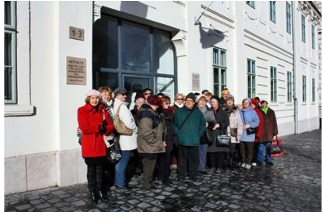
1013 Budapest, Apród u. 1-3. .) Semmelweis Ignác egykori szülőháza

Az ókortól a XX. század elejéig tartó fejlődés tárgyi, művészeti és írásos emlékeit mutatja be, A látogató nemcsak ismeretekben, hanem élményekben is gazdagodhat ebben a sajátos légkörű múzeumban: beléphet az anyák megmentőjének egykori dolgozószobájába, vagy a 200 éves, pesti Szent Lélek patika faragott bútorai közé, megnézheti a művészi kivitelű, XVIII. századi anatómiai viaszpreparátumokat, a miniatűr fogászati rendelőmodellt .